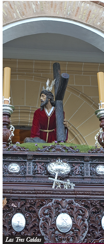
Las Tres Caídas