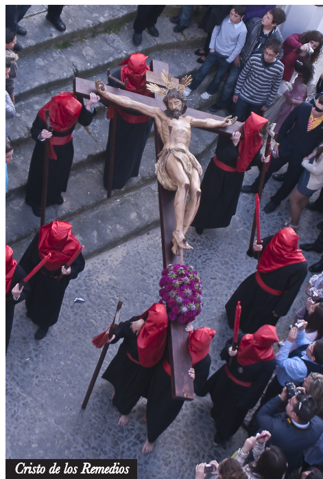
Cristo de los Remedios

HÁBITO: Los nazarenos visten túnica negra, antifaz y cingulo rojos. Tras el Cristo de los Remedios procesionan las hermanas, ataviadas con traje de mantilla.