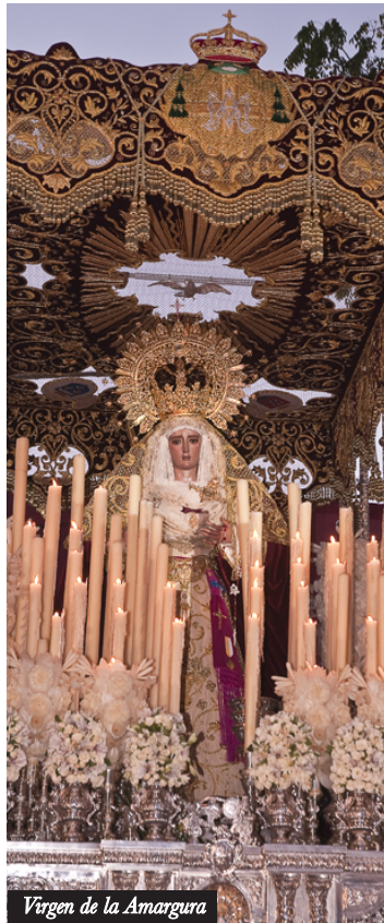
Virgen de la Amargura

HÁBITO: Los nazarenos visten túnica y antifaz negro con una cruz blanca en el pecho. El cíngulo es de esparto y las alpargatas blancas.