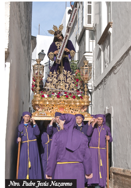
Ntro. Padre Jesús Nazareno

HÁBITO: Los nazarenos visten túnicas moradas y cingulo amarillo de cordón.