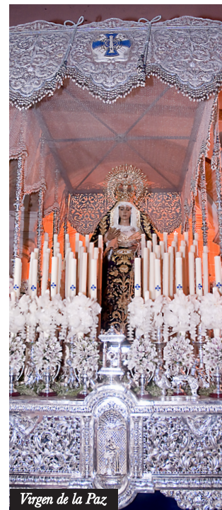
Virgen de la Paz

HÁBITO: Los hermanos del "Atado", visten túnica blanca, antifaz, capa, botonadura y cíngulos azules. Los de la Virgen llevan túnica, antifaz y capa blanca con cíngulo y botonadura azules.