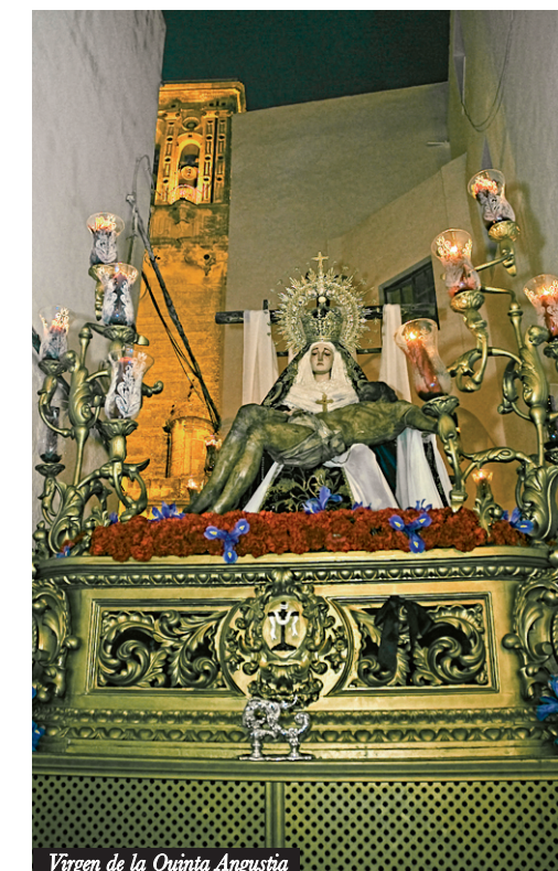
Virgen de la Quinta Angustia