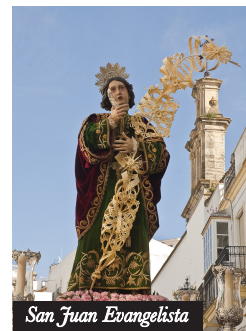
San Juan Evangelista