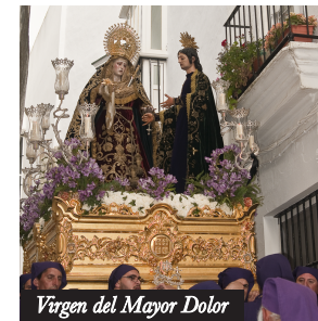
Virgen del Mayor Dolor