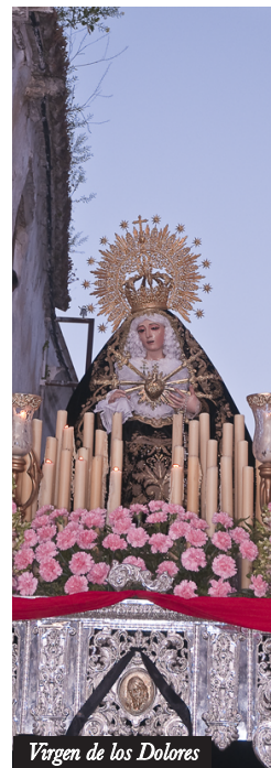
Virgen de los Dolores