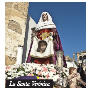
La Santa Verónica