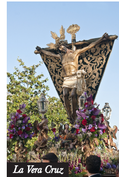
La Vera Cruz