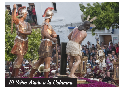
El Señor Atado a la Columna