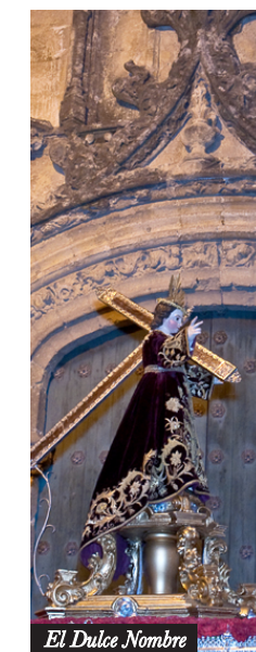
El Dulce Nombre