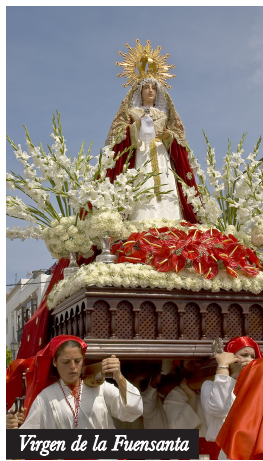
Virgen de la Fuensanta