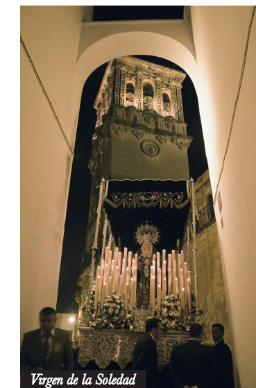
Virgen de la Soledad

HÁBITO: Los hermanos del Santo Entierro visten túnicas y antifaz negros, cinturón de esparto y alpargatas negras. Los que acompañan a la Virgen añaden al hábito una capa blanca.