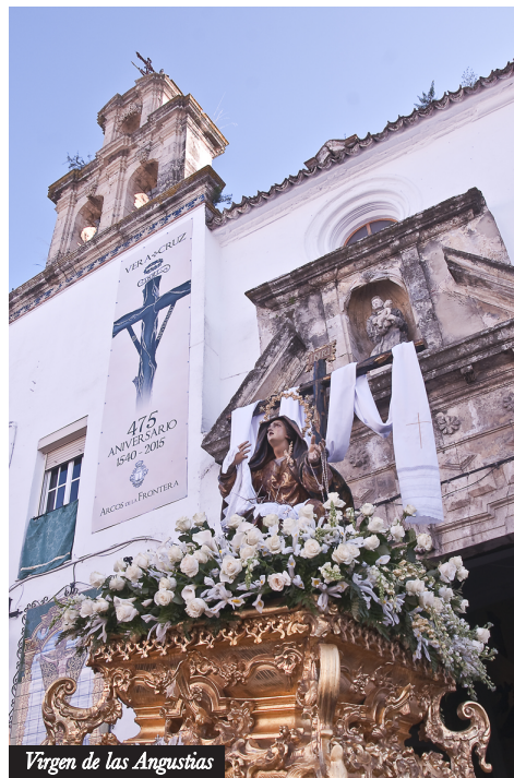
Virgen de las Angustias

HÁBITO: Los nazarenos de la Vera Cruz visten túnica blanca, botonadura, cingulo y antifaz verdes. Los de la Virgen de las Angustias visten túnica y antifaz blanco, botonadura y cingulo verdes.