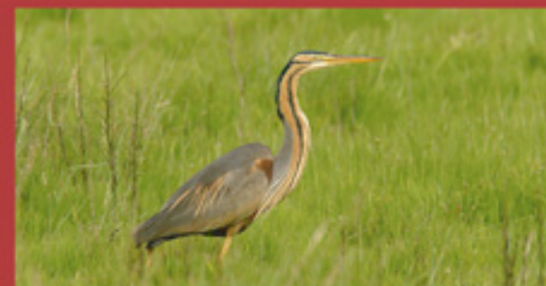
Garza imperial ( Ardea purpurea ). SEO, BirdLife.

Este sendero discurre principalmente por el trazado de la antigua línea ferroviaria que unía Jerez de la Frontera y Almargen a su paso por Arcos de la Frontera. La ruta, que recorre la antigua vía, tiene su inicio en un punto del camino de Arcos a Bornos próximo a la Pequeña Holanda.