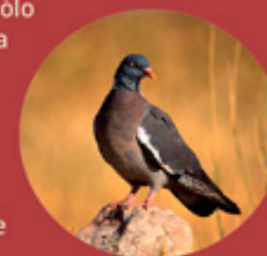
Paloma torcaz ( Columba palumbus ). SEO, BirdLife.

Mientras recorremos el sendero, podremos observar los numerosos campos de cultivo característicos de la zona y además, podremos contemplar también con relativa facilidad algunas de las especies de aves esteparias asociadas a esta zona agrícola. Pero no sólo disfrutaremos de una estampa agrícola en este sendero, dos de los atractivos más importantes de esta ruta son el embalse de Arcos y su Paraje Natural.